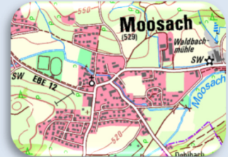
Digitale Topographische Karte für den regionalen Überblick (kostenfrei)