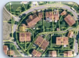
Digitales Orthophoto (DOP) mit Flurkarte